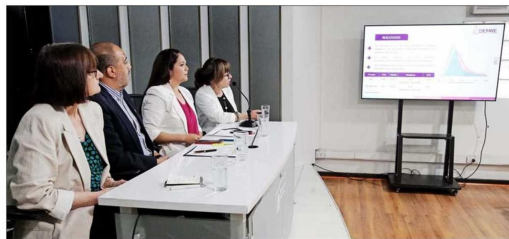
Resultados Ayer en la mañana el Mineduc entregó los resultados. El ministro Ávila aseguró que, como Gobierno, están comprometidos a mejorar el proceso de admisión.

La brecha en la prueba de Matemática 2 también entra en la categoría de "grande", con un 1,33. Si se compara en los resultados de Matemática entre particulares pagados y subvencionados, también se perciben bre-